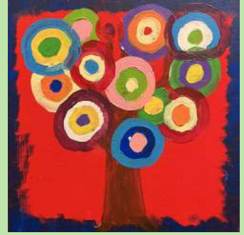
DWS 16 De boom van Kandinsky