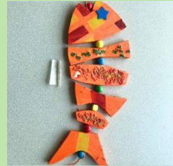
DWS 7 Vismobiel