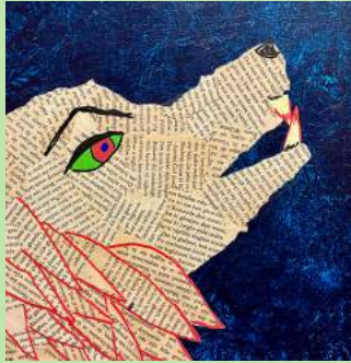
DWS 2 Gescheurde wolven