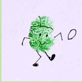
Doorloper Figuur tjes van je vingerafdruk