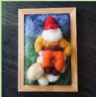
DWS 9 Wolschilderij