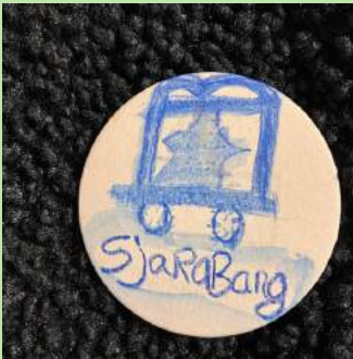
Doorloper Buttons maken