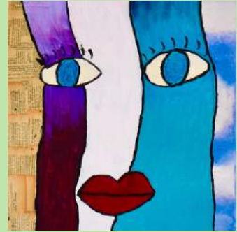
DWS 3 Schilderen naar Tom Fedro