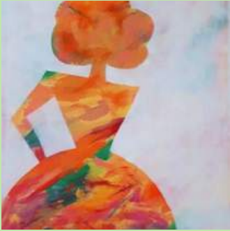
DWS 1 Silhouet schilderen