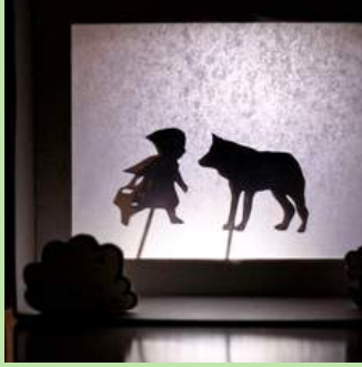
DWS 15 Schaduwpoppen maken