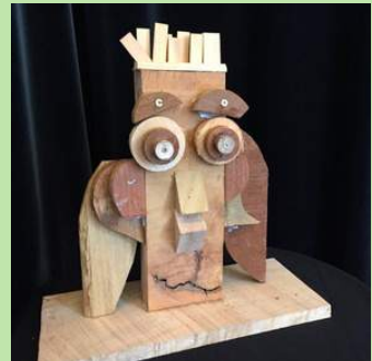
Doorloper Houten maskers