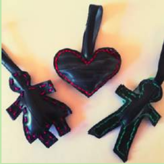
DWS 14 Sleutelhangers van fietsband