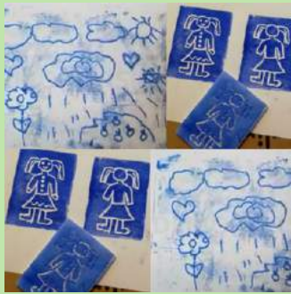
DWS 18 Druktechnieken