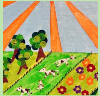
DWS 20 Landschap schilderen