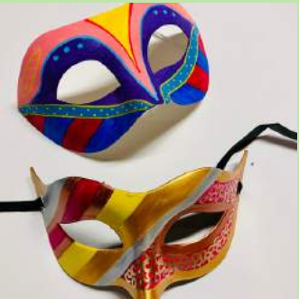
DWS 21 Venetiaanse maskers