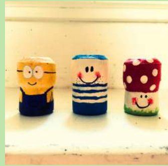
Doorloper Mannetje van kurk