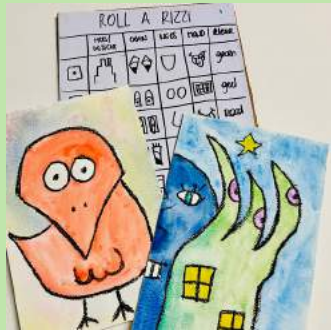
DWS 17 Aquarel schilderen naar James Rizzi