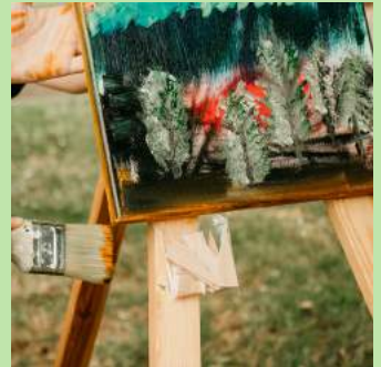
DWS 23 Schilderen met Bob Ross