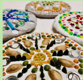
DWS 11 Mandala's van klei