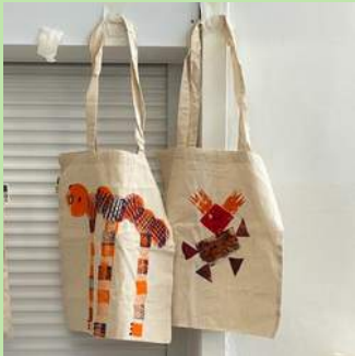
DWS 4 Kunstige draagtas