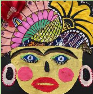
DWS 22 Collage van Afrikaanse stofjes