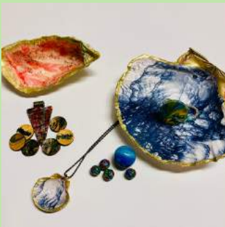
DWS 8 Juwelen maken